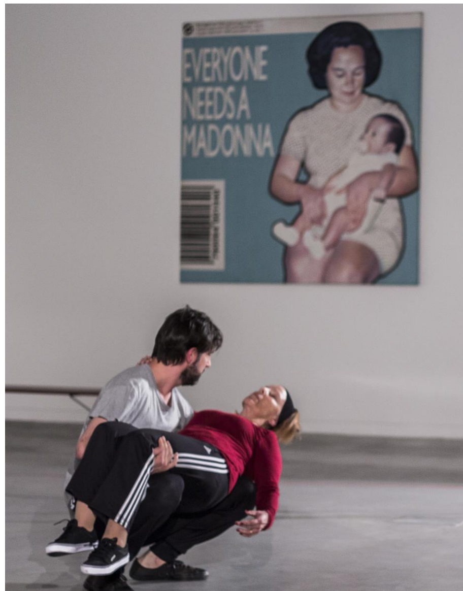
MI CONTUNDENTE SITUACIÓN de Diana Szeinblum.