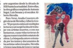
Acuarela de Berni PARA AGENDAR

● Hoy función de “Mi contundente situación”, de Szteinblum, a las 20. Av. San Juan 350. Entrada general al Museo: $ 20