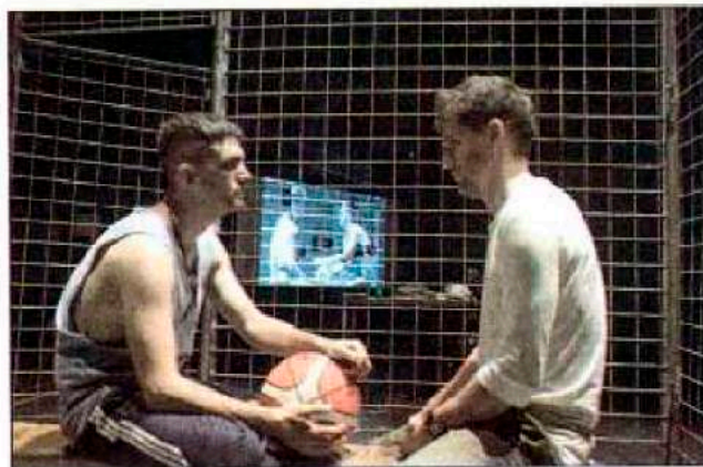
Escena de 'Tebas Land' en Timbre 4.