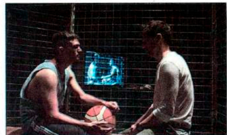
'Tebas Land', en Timbre 4.